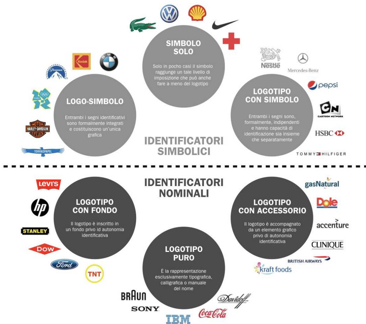
Diagramma di mega-tipi di marchio (Cassisi, Belluccia, Chaves).

In ognuna di queste “mega tipologie” si visualizza una tipologia interna con varie sfumature, consentendo altre sottoselezioni che definiscono il marchio con maggiore precisione e adeguamento al caso. E, ovviamente, tra questi mega tipologie possiamo individuare tipologie ibride le cui identità generiche, per così dire, “oscillano” seguendo lo sguardo che dà priorità ad una o altra caratteristica. Un “logotipo con fondo”, a seconda delle caratteristiche di quello sfondo, può essere più vicino al “logo-simbolo” e un “logotipo con accessorio”, a seconda delle caratteristiche di quell'accessorio e del suo utilizzo, può essere simile alla tipologia “logotipo con simbolo”.