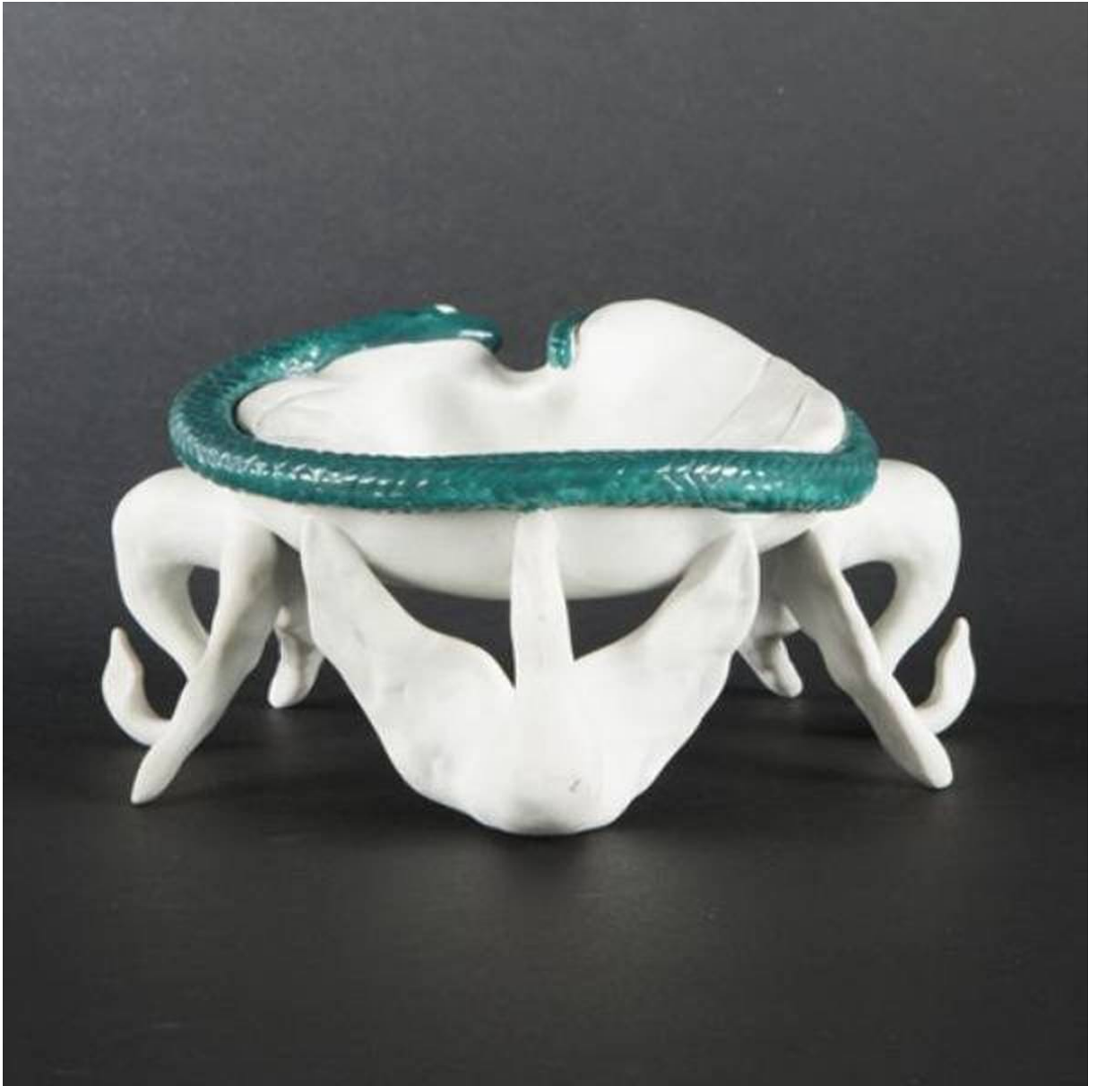
Posacenere progettato per le linee aeree Air-India disegnato da Salvador Dalí.