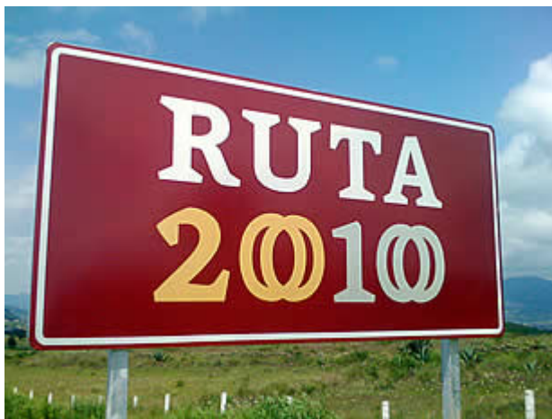
Señalización de caminos y carreteras a lo largo y ancho de México de destinos ligados a las fechas conmemoradas titulados como «Ruta 2010»