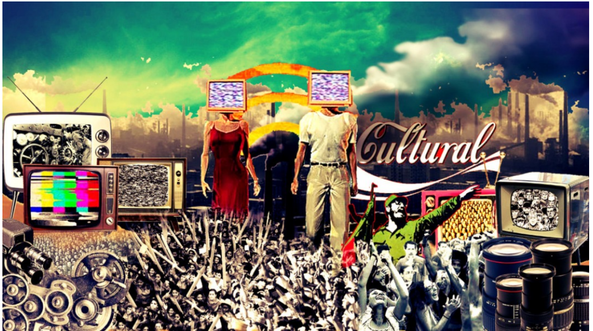
Anónimo. Industrias culturales. Ilustración. Aprendecultura

tradiciones de identidad. Los mecanismos tecnológicos, la globalización y la producción establecieron las nuevas tendencias y estilos en las artes, la publicidad y la moda. Las industrias culturales han pasado a ser actores principales en referencia a la comunicación global. En Latinoamérica las artes, la literatura y la música proporcionan herramientas culturales para generar reflexiones acerca de qué es «ser nacional», «[...] de Sarmiento y Arguedas hasta Neruda, Paz y Borges, desde el muralismo mexicano y boliviano hasta el tango y el folclore andino». (García Canclini, 1995)