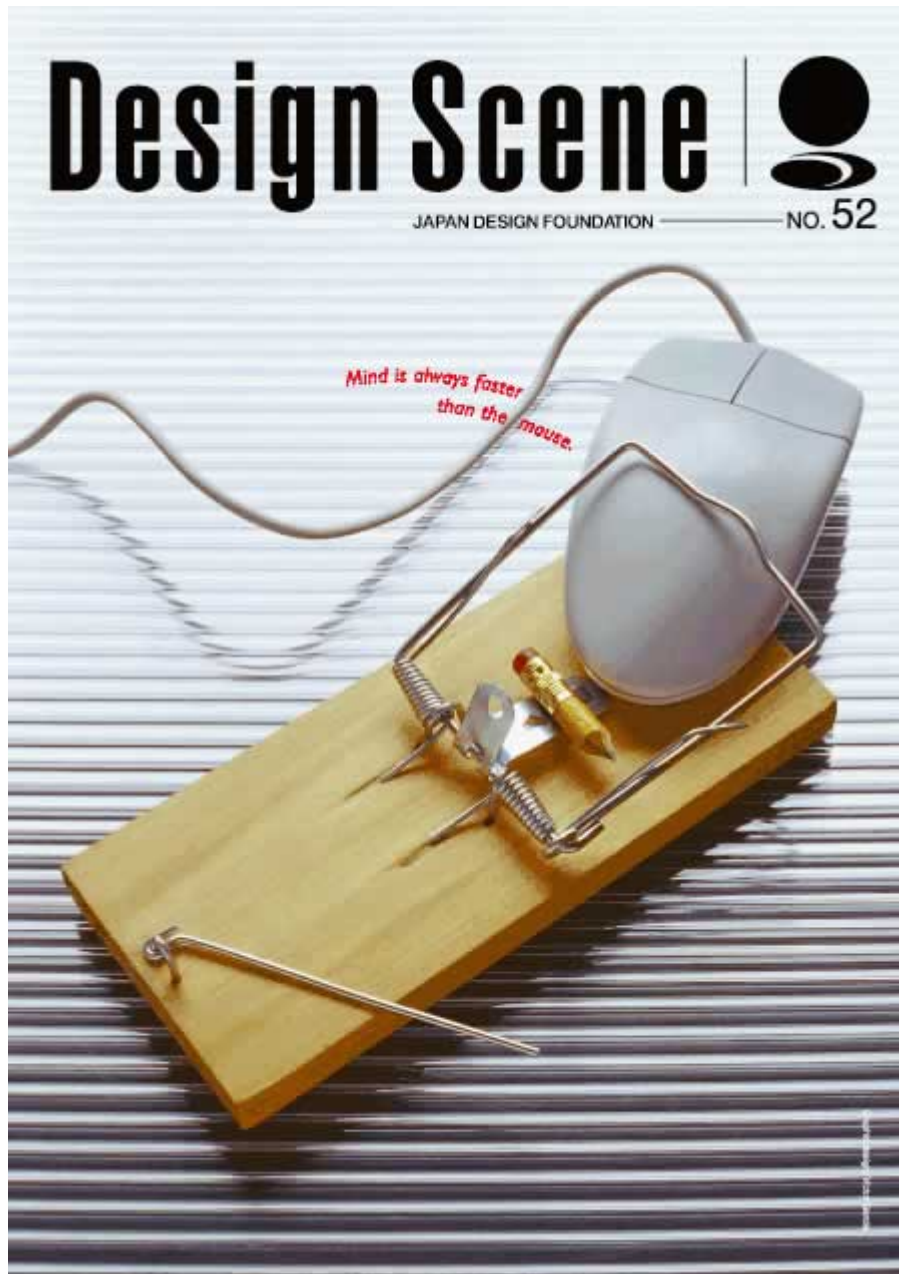
Título: «La mente siempre es más rápida que el mouse». Design Scene Nº 52, Japan Design Foundation. Publicado en IcoGrada Galleria online. Idea, foto y diseño: Víctor García, 2001. 1