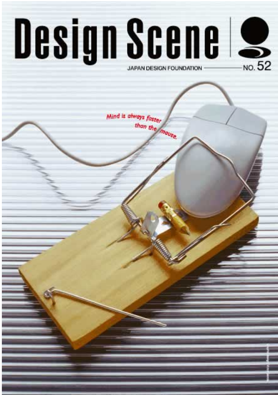
Título: «La mente siempre es más rápida que el mouse». Design Scene Nº 52, Japan Design Foundation. Publicado en IcoGrada Galleria online. Idea, foto y diseño: Víctor García, 2001. 1

Mucha energía... Eones de energía.... Montañas de energía disipadas... Pero no en la reflexión que motivó la producción del artículo aquél en sí; en cualquier caso, no con el mismo entusiasmo. Sino en busca de la adecuación tecnológica que me permitiera no caerme del mundo conocido. Al menos, de esa forma del mundo, que produce chiches tecnológicos para entretenernos y hacernos creer en la contemporaneidad como quién cree en Versace.