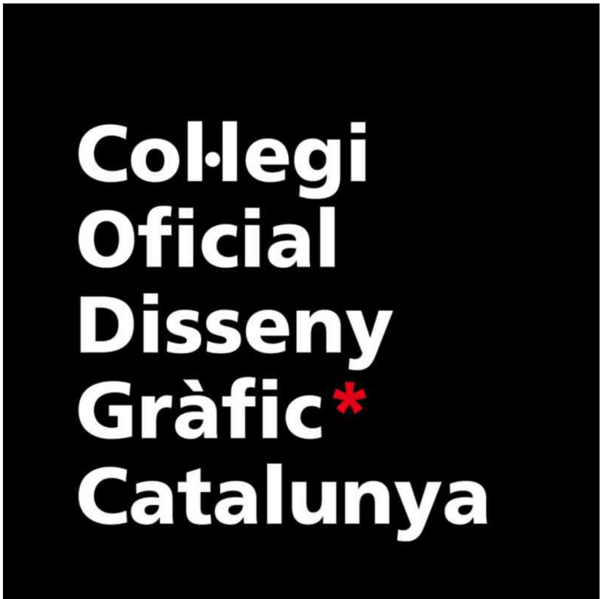
Logo del Colegio Oficial de Diseño Gráfico de Cataluña.

Gráfico de Cataluña. El 25 de marzo de 2009 se modifican los estatutos para denominarlo Colegio Oficial de Diseño Gráfico de Cataluña.