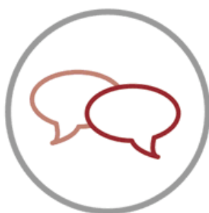
Information Design Thinking

El diseño de información se desarrolla más allá de las nuevas tecnologías o medios digitales, ya que estas herramientas y soportes no son esenciales para esta disciplina. Por un lado, se están aplicando formas de pensamiento y lenguajes del diseño de información como metodología para resolver problemas de comunicación, transmisión de información, organización o educación, que se conoce como Information Design Thinking . Esta metodología de trabajo desglosa un problema de forma objetiva y sistemática, extrayendo las ideas principales y organizándolas visualmente de forma que se evidencien con mayor claridad nuevas relaciones, puntos de vista y posibles soluciones.