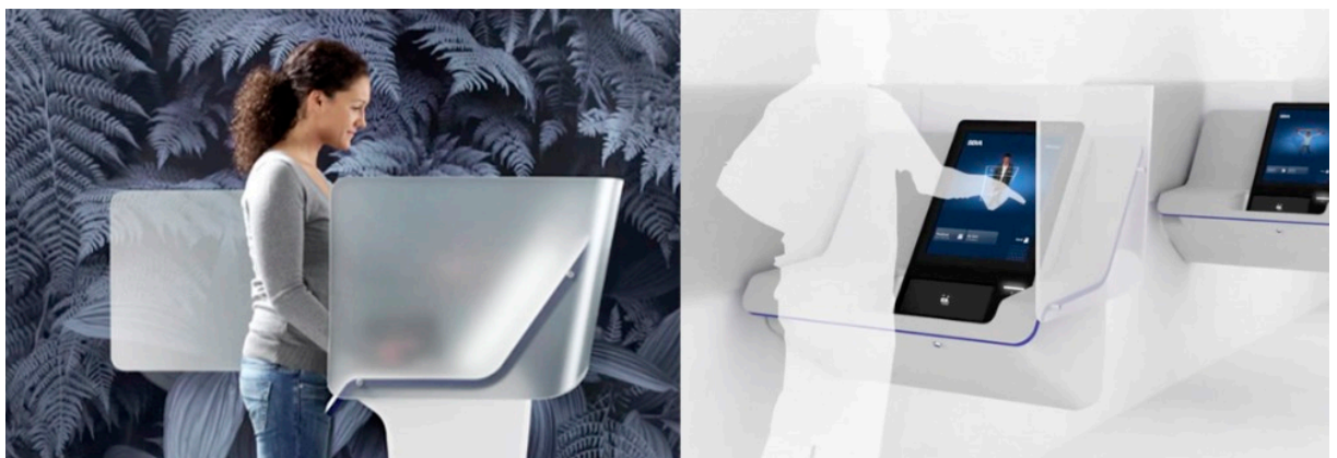
Simplicidad y rapidez. IDEO - BBVA.