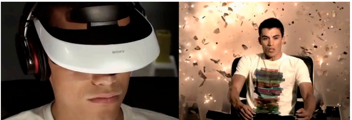
Inmersión. Sony 3D Viewer.

La intensificación de los medios de comunicación, que ha proliferado de manera desmedida en los últimos años, articula y condiciona la cultura actual. Dênis de Moraes menciona que en el escenario mediático reciente, las tecnointeracciones ejercen una gran influencia en los patrones de sociabilidad y en las percepciones de los individuos. 6 El desarrollo de contenidos infinitos en los medios de comunicación, así como la personificación de estos hace evidente el fin de los tiempos muertos, con ello, la velocidad, la accesibilidad y la simplicidad, se perfilan como tendencias en el desarrollo de productos, pero de igual manera, como estilo de vida.