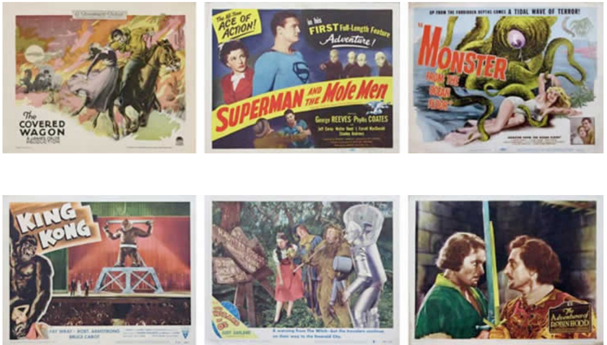
Algunos ejemplos de lobby cards.

Por lo general eran producidas en series (entre 6 y 12 piezas), cada una de las cuales representaba diferentes escenas del film. En América se produjeron hasta 1985, razón por la que luego empezaron a importarse desde Europa.