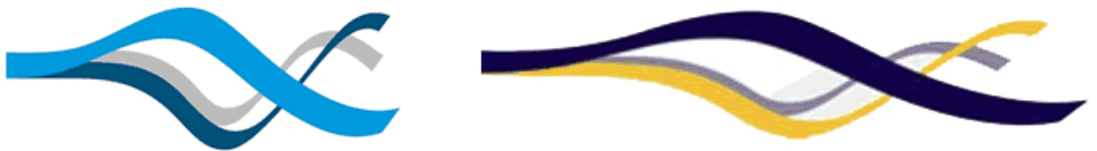
Comparación de dos signos gráficos demasiado parecidos.

Se puede apreciar que el programa de identidad corporativa de Al Masraf lleva bastante tiempo en marcha.