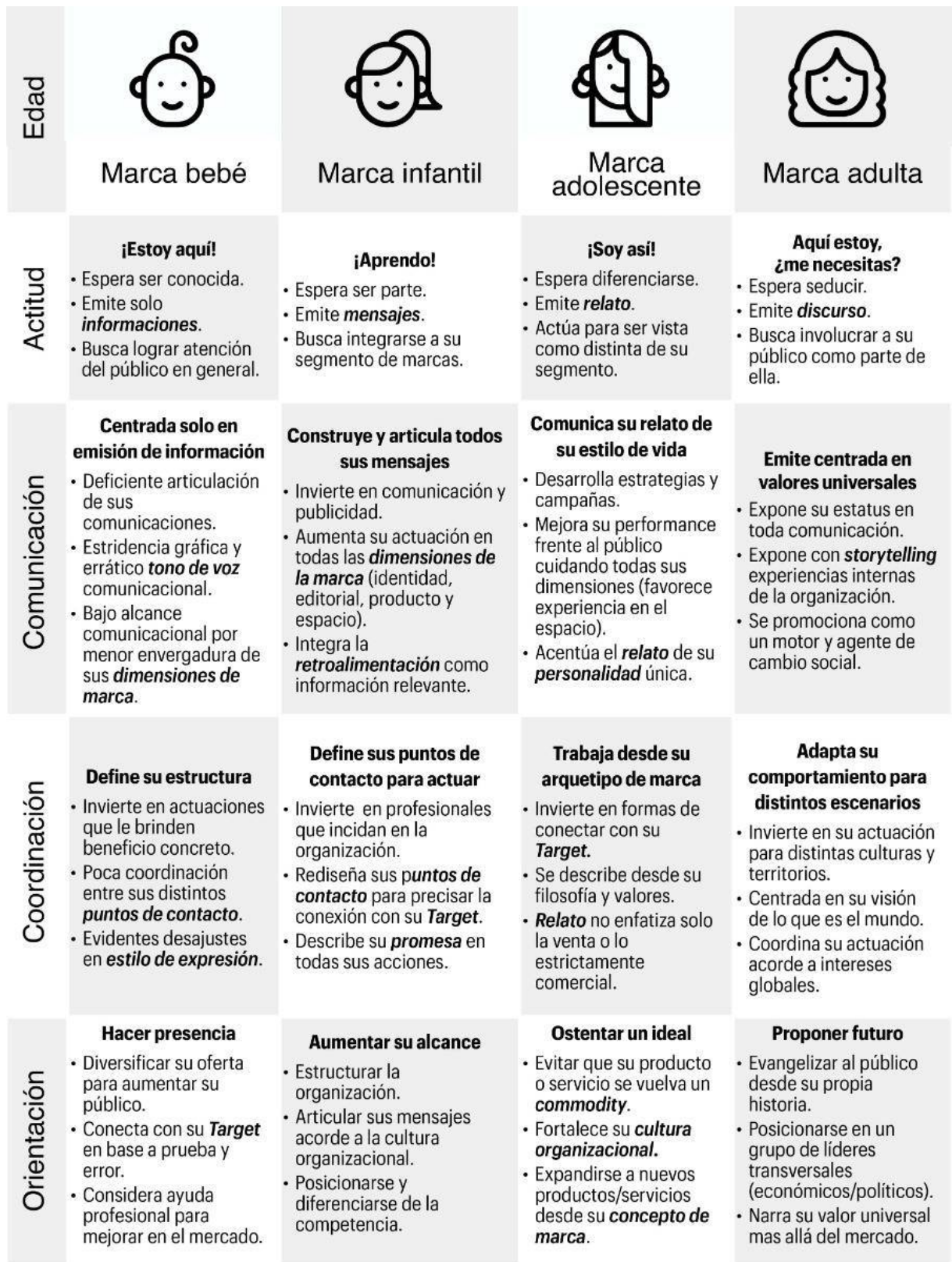
Tabla resumen con criterios por edad.