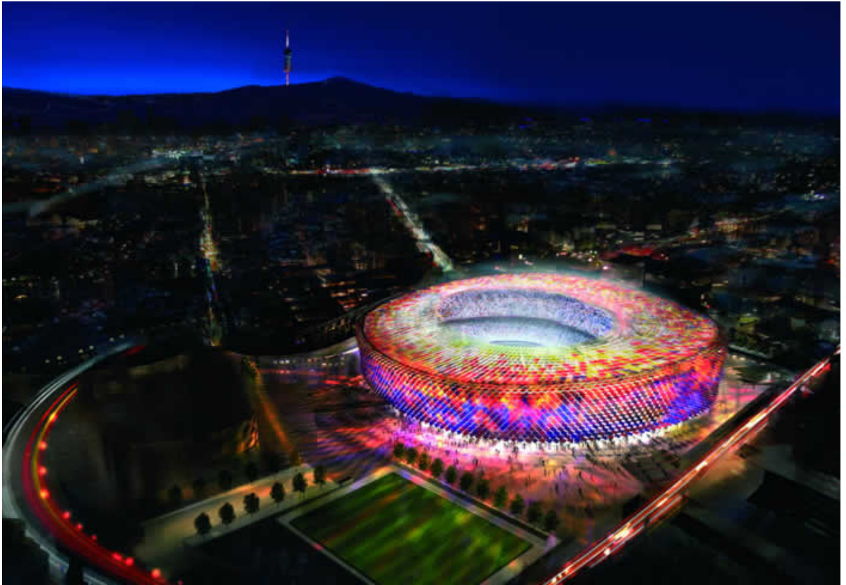
Proyecto de ampliación del estadio Camp Nou, Barcelona.

El proceso y el resultado final hacen plantearse seriamente la validez de los concursos, que solamente contribuyen a la realización de proyectos espectaculares. Eso es lo que sucede cuando los clientes no entienden de arquitectura de la misma manera que lo hacen de fútbol. De hecho, estoy seguro que el resultado sería mejor si el encargo se hubiera hecho directamente al estudio ganador, y en lugar de hacer concursar otros equipos, se los podría convocar para asesorar al F.C. Barcelona en las preguntas y consultas adecuadas que deben realizar a los proyectistas. Porque, para un buen proyecto no es suficiente un buen proyectista, es necesario también un buen cliente. La ciudad lo habría agradecido.