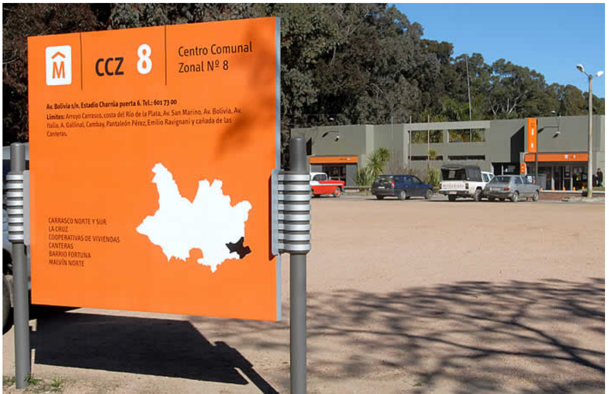
Cartelería para los Centros Comunales Zonales.