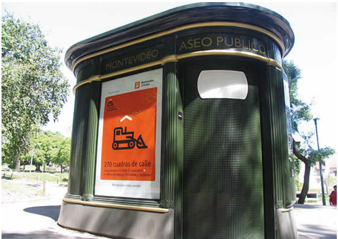
Parte de la campaña de publicidad vía pública, Programa «Puesta a Punto».