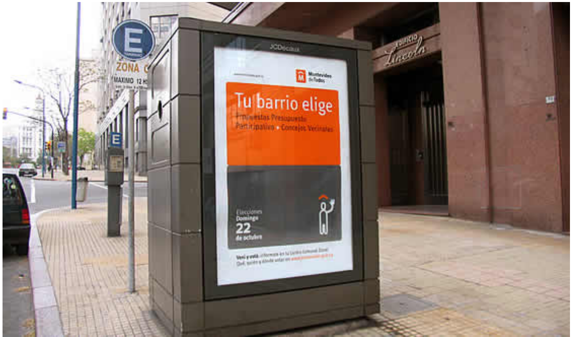
Publicidad de elecciones para el "Presupuesto Participativo 2006".