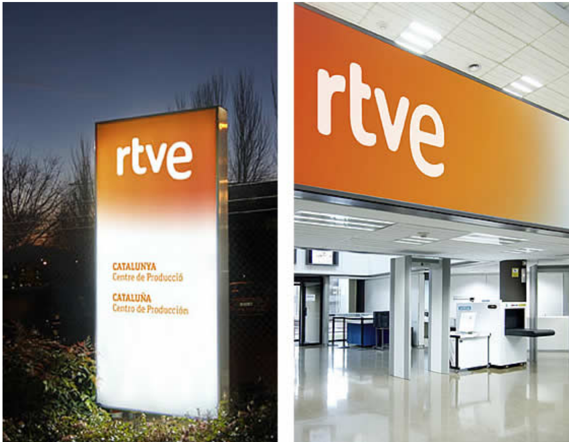
Sistema de señalización y rotulación de interiores y exteriores.