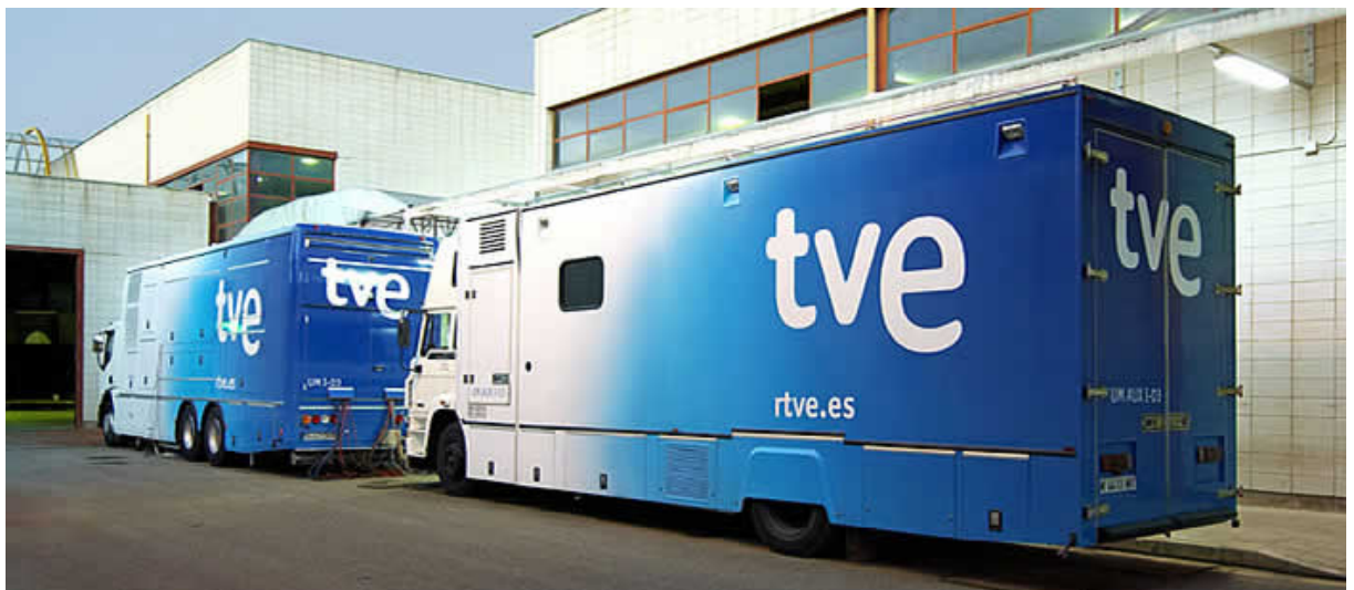
Unidades móviles para TVE donde el halo se adapta a la forma del vehículo.