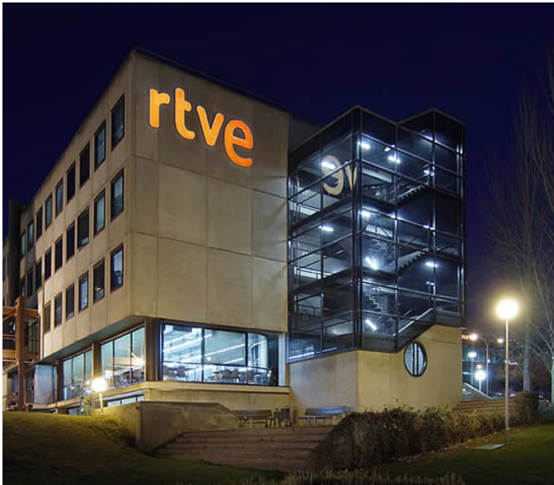
Señalización exterior de RTVE.

Sistema de identidad visual: consistencia, movimiento y luz. La tipografía de los logotipos fue dibujada a medida. Sus formas redondeadas permiten que la luz fluya fácilmente a través de las letras animadas, y hablan un lenguaje digital más adecuado para las nuevas audiencias.