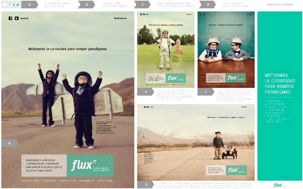
«Campaña Curiosos Fluxit», de Estudio Demaro (Argentina), ganador del CLAP Platinum al Mejor Anuncio o Campaña en prensa gráfica.