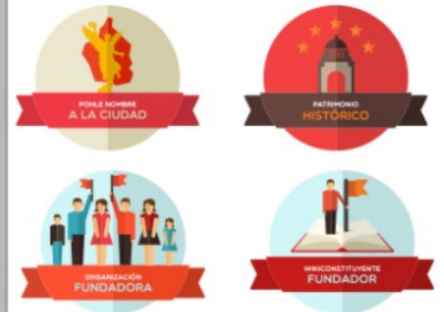
Aureacode, «Wikiconstrucción». CLAP Platinum 2013 a la Mejor Campaña por Medios Digitales