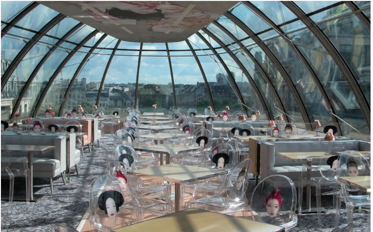
Restaurante Kong de París diseñado por Phillippe Starck.

Encontramos genios en las ciencias, en la tecnología, en las artes, la música, la literatura y otras manifestaciones, pero en diseño me resulta difícil calificar a alguien como genio. Puedo pensar de manera inmediata en Phillippe Starck como un gran talento y genio del diseño, por su diversidad y fluida creatividad que marcan estilo en sus productos industriales, arquitectónicos, de interiores. Ha producido gran cantidad de objetos y espacios importantes, trascendentes e icónicos. Se trata de una inteligencia y creatividad genial.