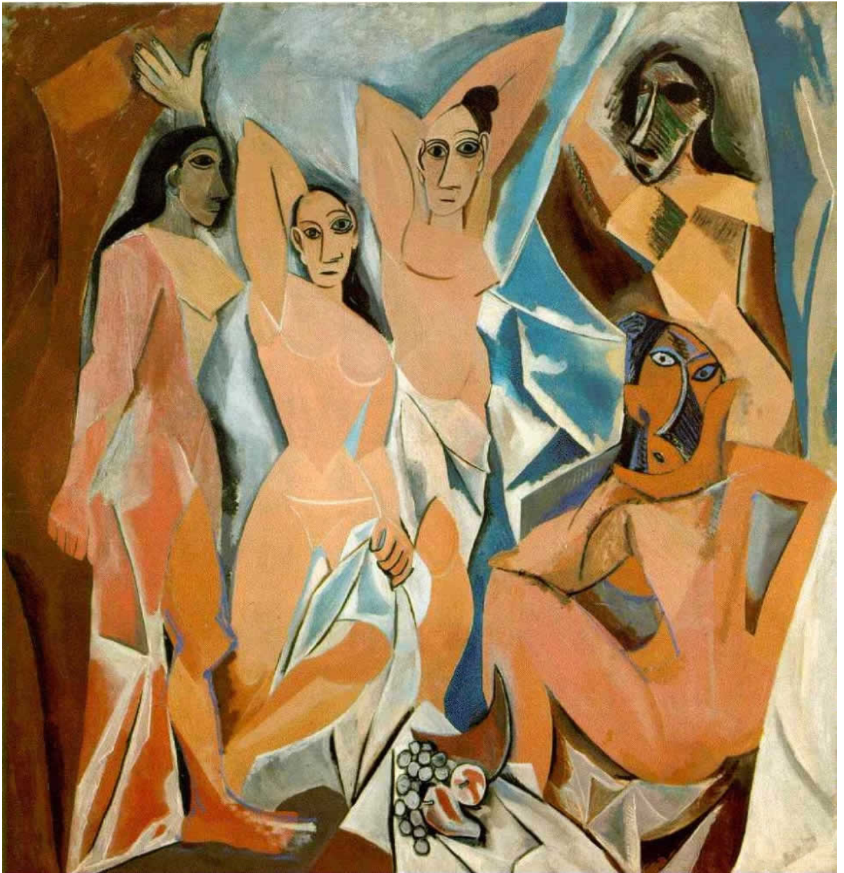
Pintura de Pablo Picasso: Las señoritas de Avignon .

Dalí, al igual que Picasso, era un artista trabajador, tenaz, creativo, firme y pertinaz hasta lograr sus objetivos. Picasso era un niño que no dibujaba como niño, era un prodigio. Los dos artistas que utilizamos como ejemplo fueron talentos extraordinarios, sumamente creativos. Dalí era tan altivo que decía: «la única diferencia entre los artistas surrealistas y yo, es que Dalí es surrealista». Dalí era un genio por tratarse de un artista con una creatividad particularmente original, un gran maestro de la pintura, como Velázquez.