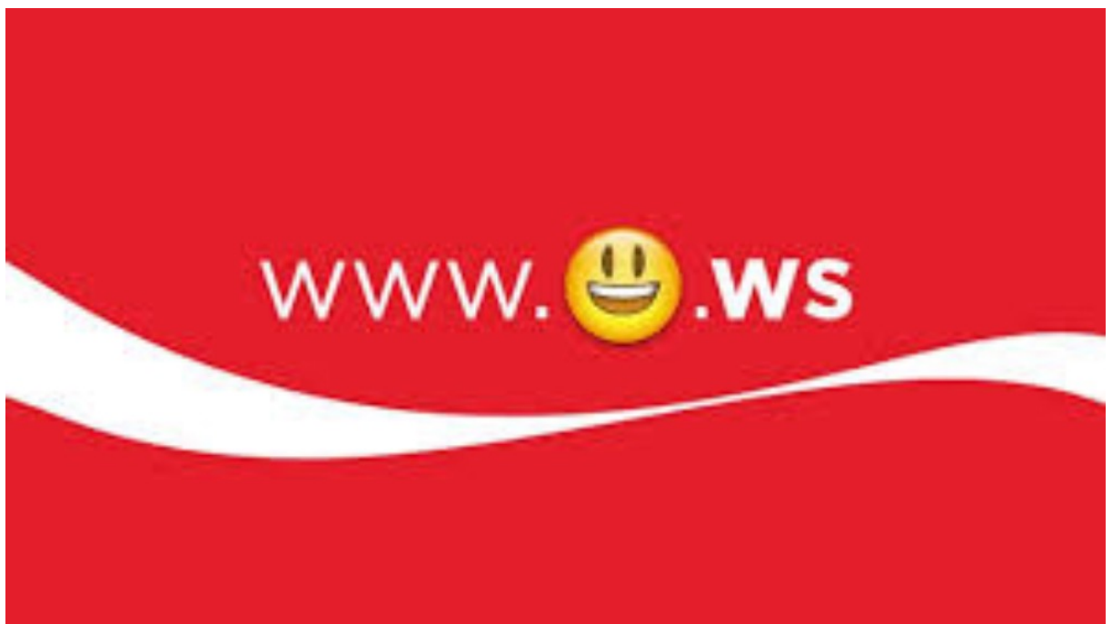
Coca Cola y la primera URL con un emoticón.

Es por eso que Ikea, Coca Cola, Mentos, Taco Bell, Comedy Central, GE, Coors Light, entre otras marcas, están aprovechando el emoticón como recurso para conseguir múltiples niveles de relación ( engagement ) entre el usuario, su familia, sus amigos y la marca. Es notable el poder de estos íconos, ya que cuando una marca es capaz de atraer al usuario para descargar su paquete de emoticones, logra no ser percibida como publicidad, sino como generadora de una nueva forma de expresión.