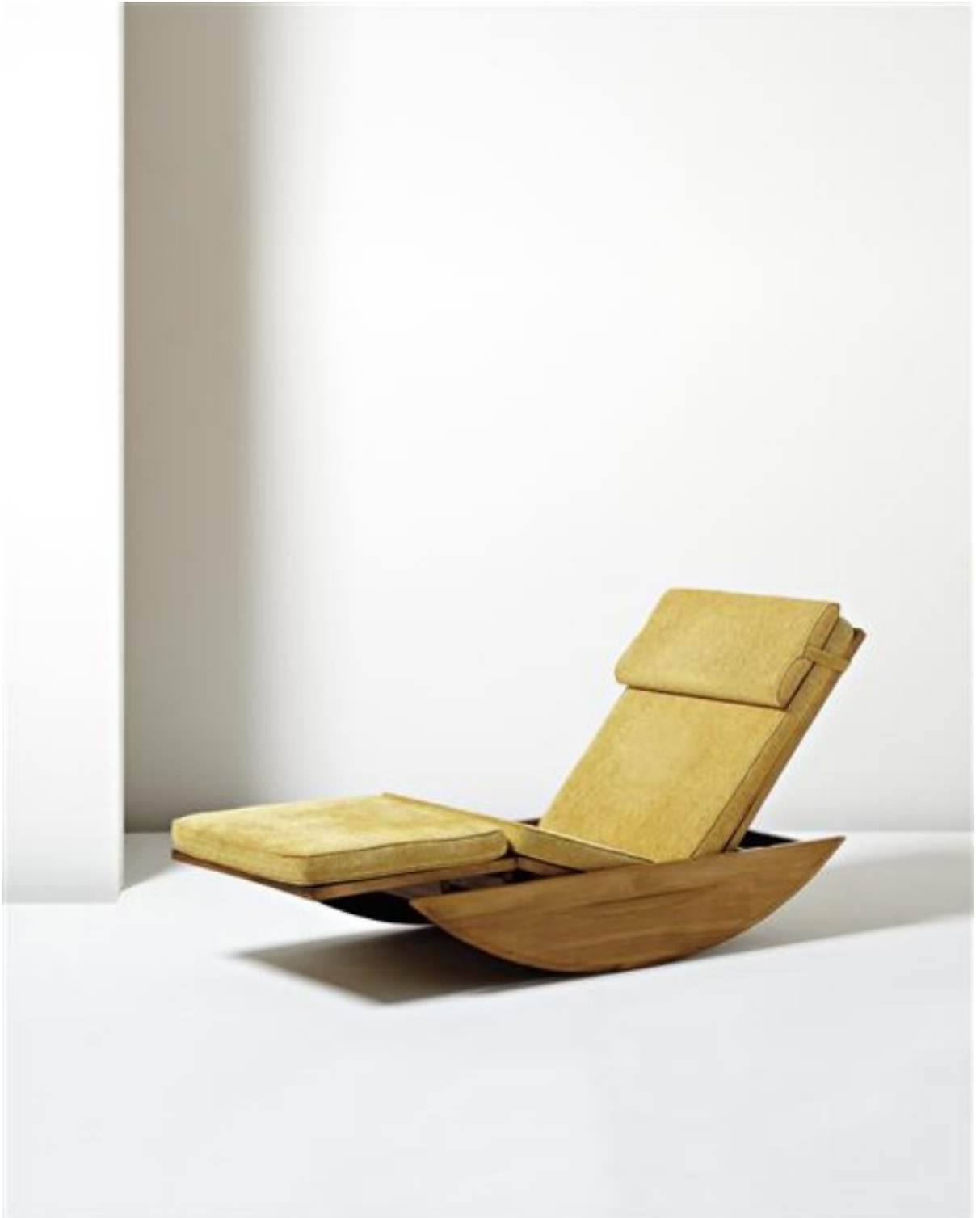
Silla Lounge Rocking . Joaquin Tenreiro