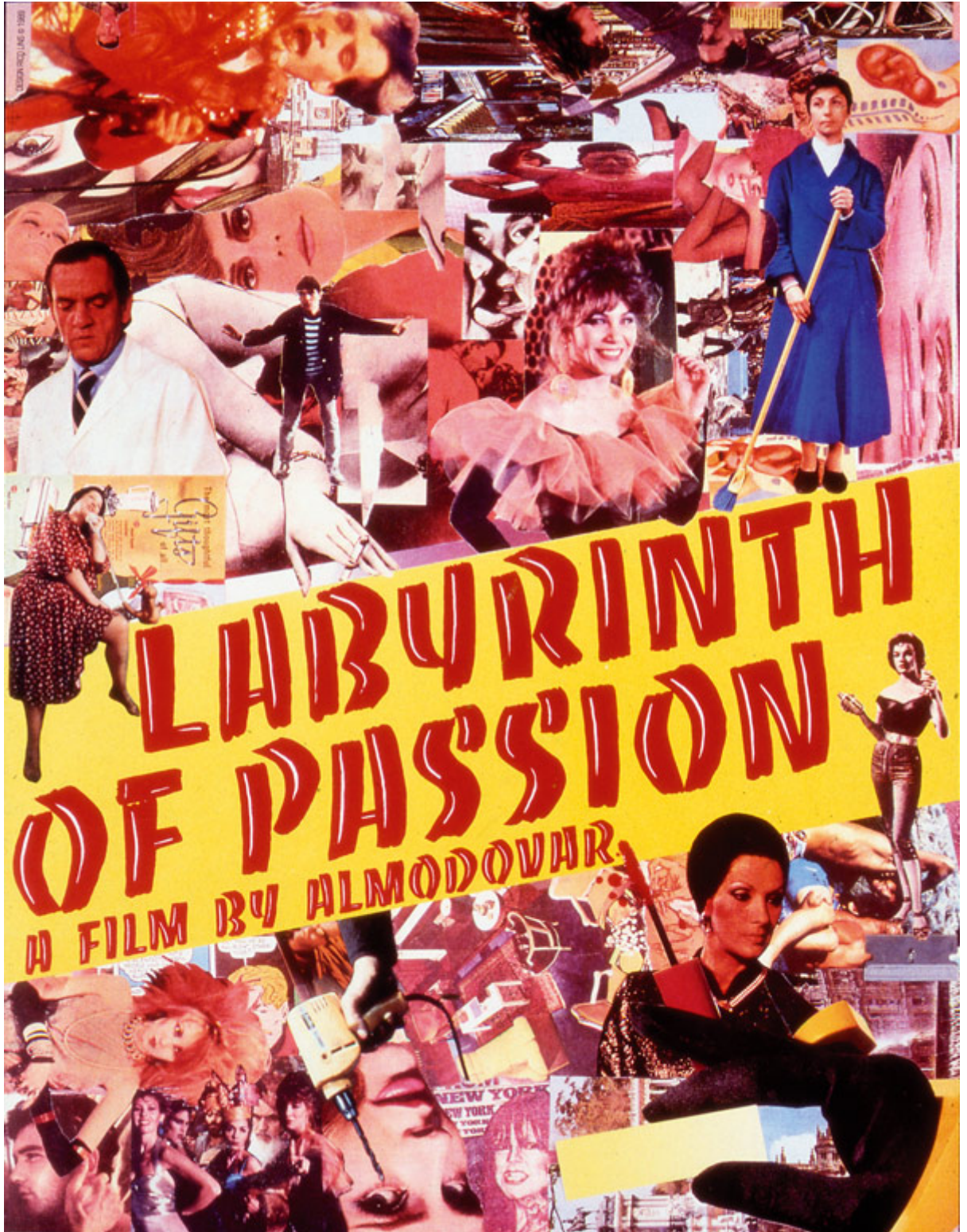
Póster para el lanzamiento en EEUU del film Laberinto de pasiones , de Pedro Almodóvar, 1989