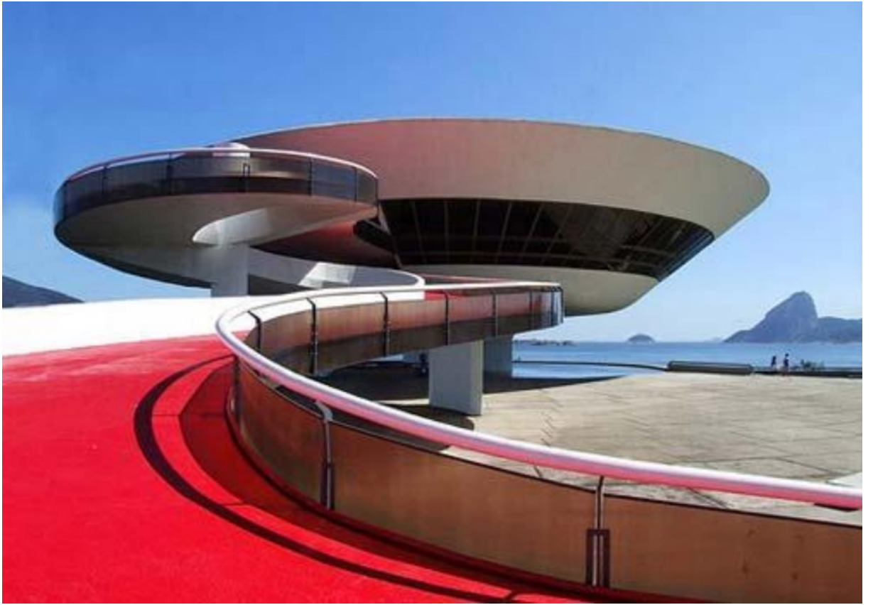
Museo de Arte Contemporáneo de Niterói. Oscar Niemeyer