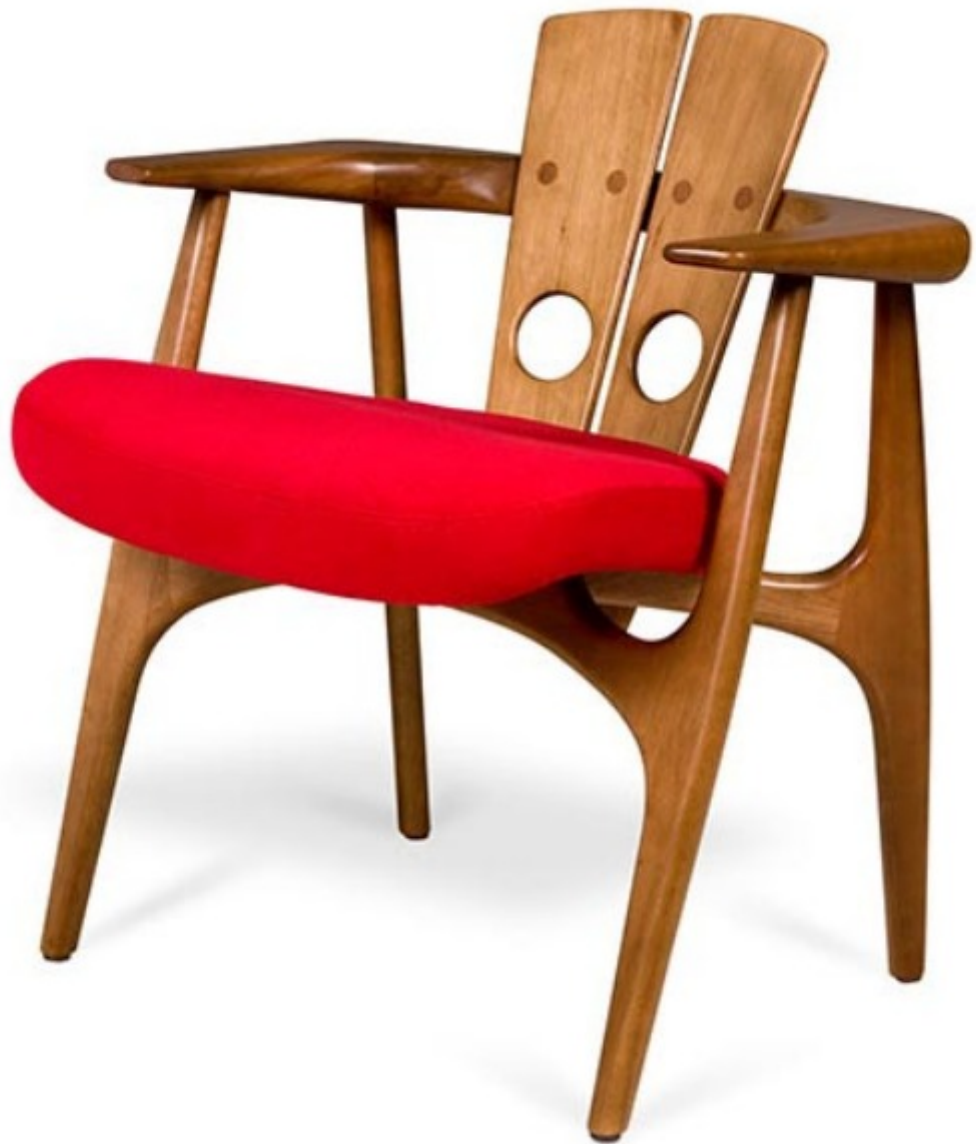
Silla. Sérgio Rodrigues