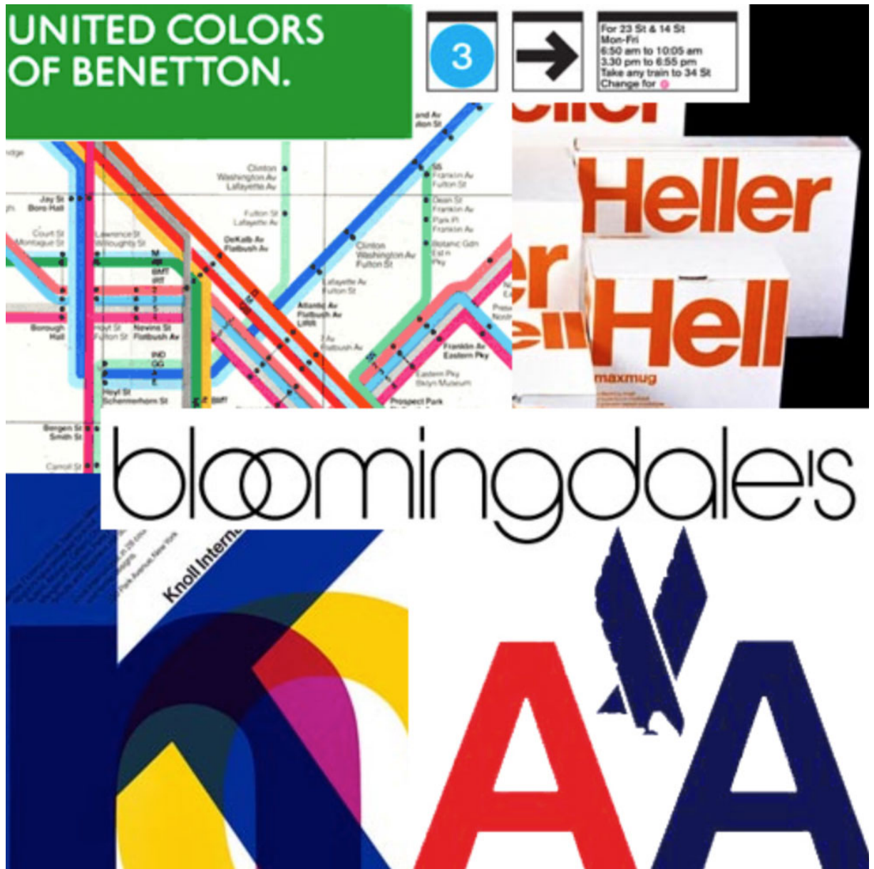
Algunos trabajos de Massimo Vignelli.

Hoy, a manera de homenaje, recogemos algunos extractos de ese texto, sin la pretensión de hacer un resumen o una interpretación, sino más bien, como una invitación a descargar, leer y discernir su contenido, que se encuentra disponible de forma gratuita y a disposición de cualquier interesado en su sitio. 1