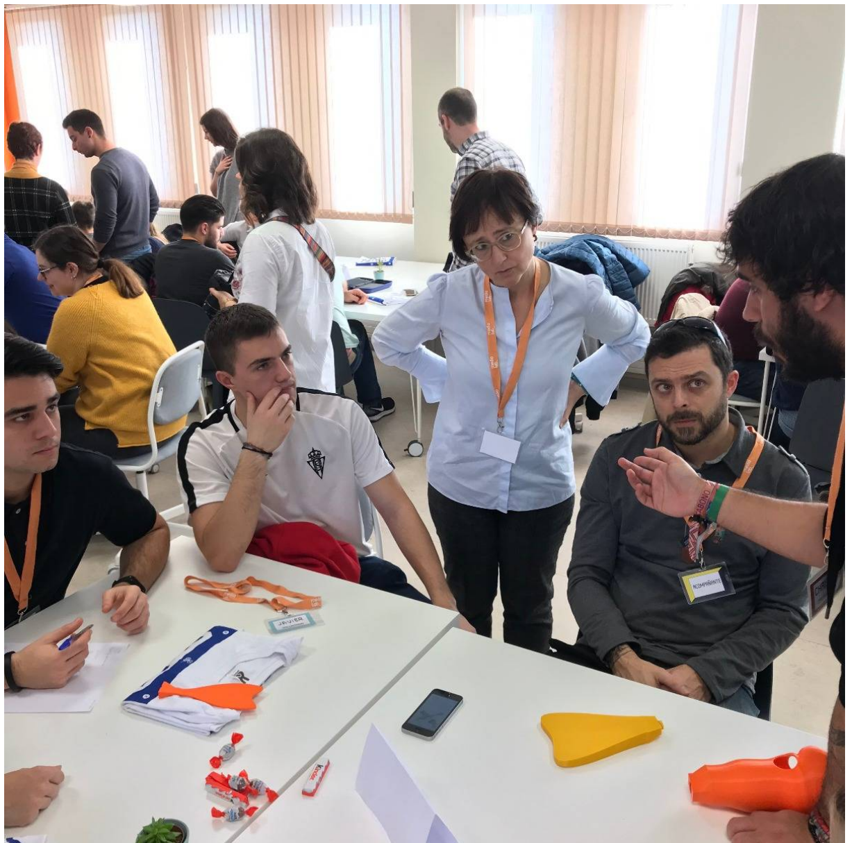
Proyecto Supergiz. Autofabricantes. MediaLab Uniovi

Una mirada sobre nuevos abordajes en el diseño.