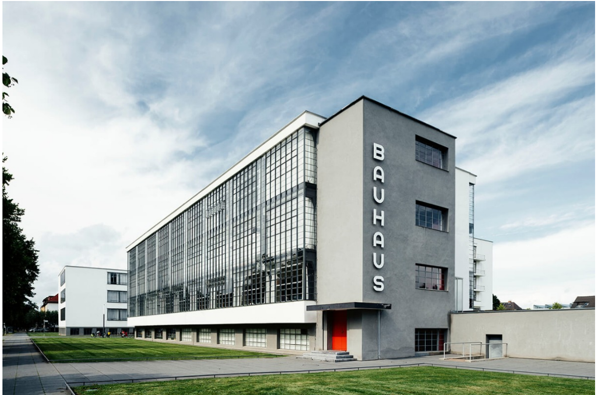
Edificio de la Bauhaus en Dessau (1925/1926).

En sus experimentos, en sus audaces innovaciones se abandonó el modelo esteticista de la época, y se propuso otro basado en el valor de la máquina, y la formación de un hombre nuevo. La Bauhaus fue un crisol donde se fundieron las ideas de personajes de la talla de Walter Gropius, Paul Klee, Vasili Kandisky, Johannes Itten, y tantos otros, para producir un verdadero cisma que sacudió los cimientos del diseño contemporáneo y cuyos fundamentos aún hoy podemos encontrarlos en el espíritu que alimenta los MediaLabs en diferentes partes del mundo.