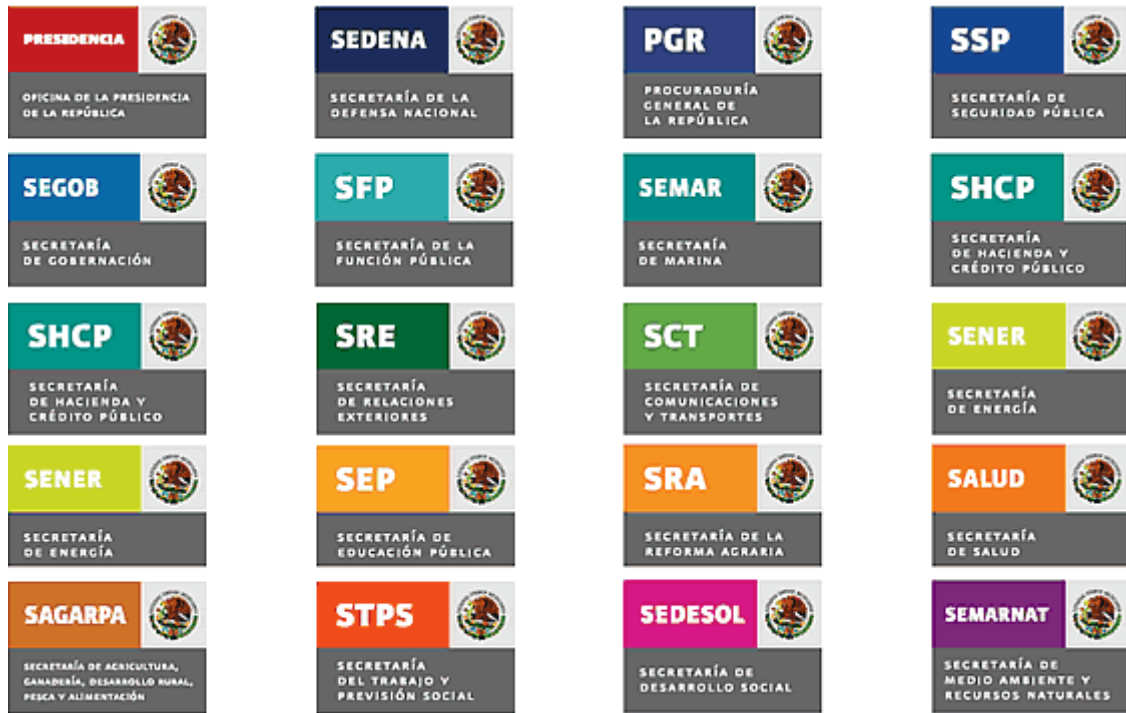
Sistema cromático para las 19 dependencias de gobierno.