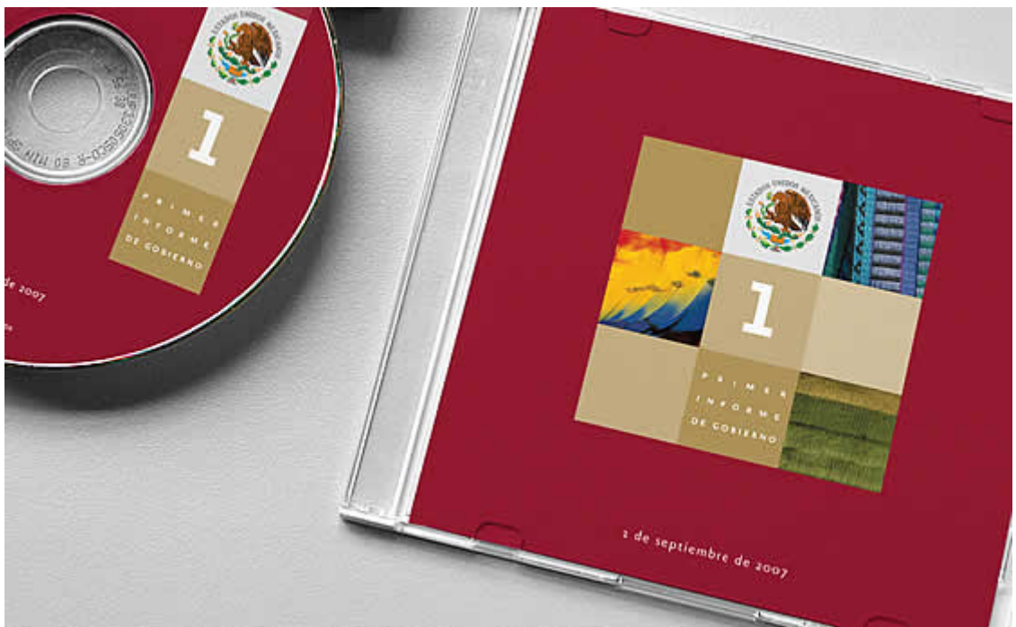
Portada y etiqueta para CD.