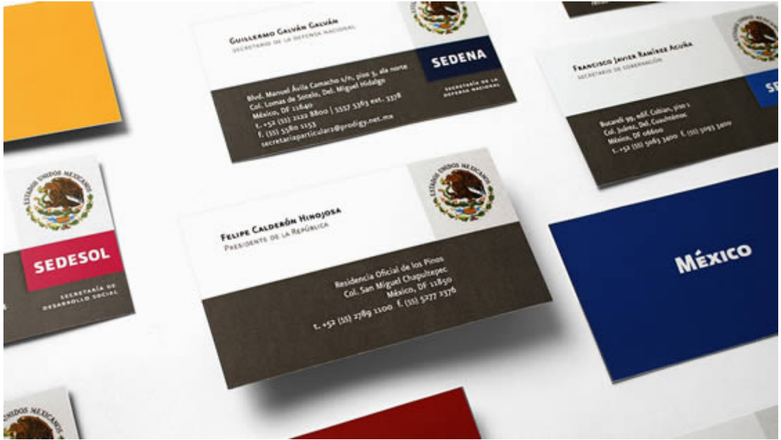
Tarjetas de presentación.