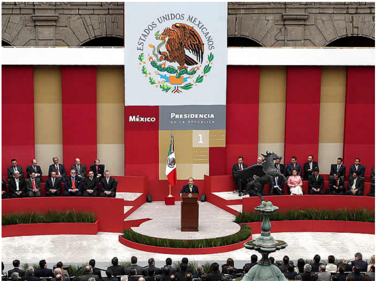
Sesión de presentación, primer informe de labores (México, 2007).