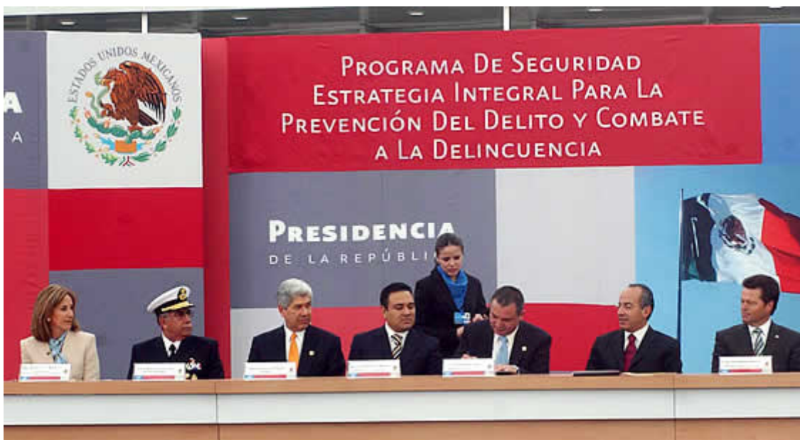
Back para acto oficial.