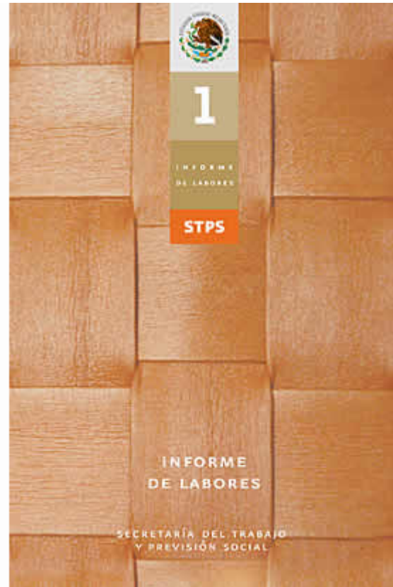
Portadas de documentos, primer informe de labores.