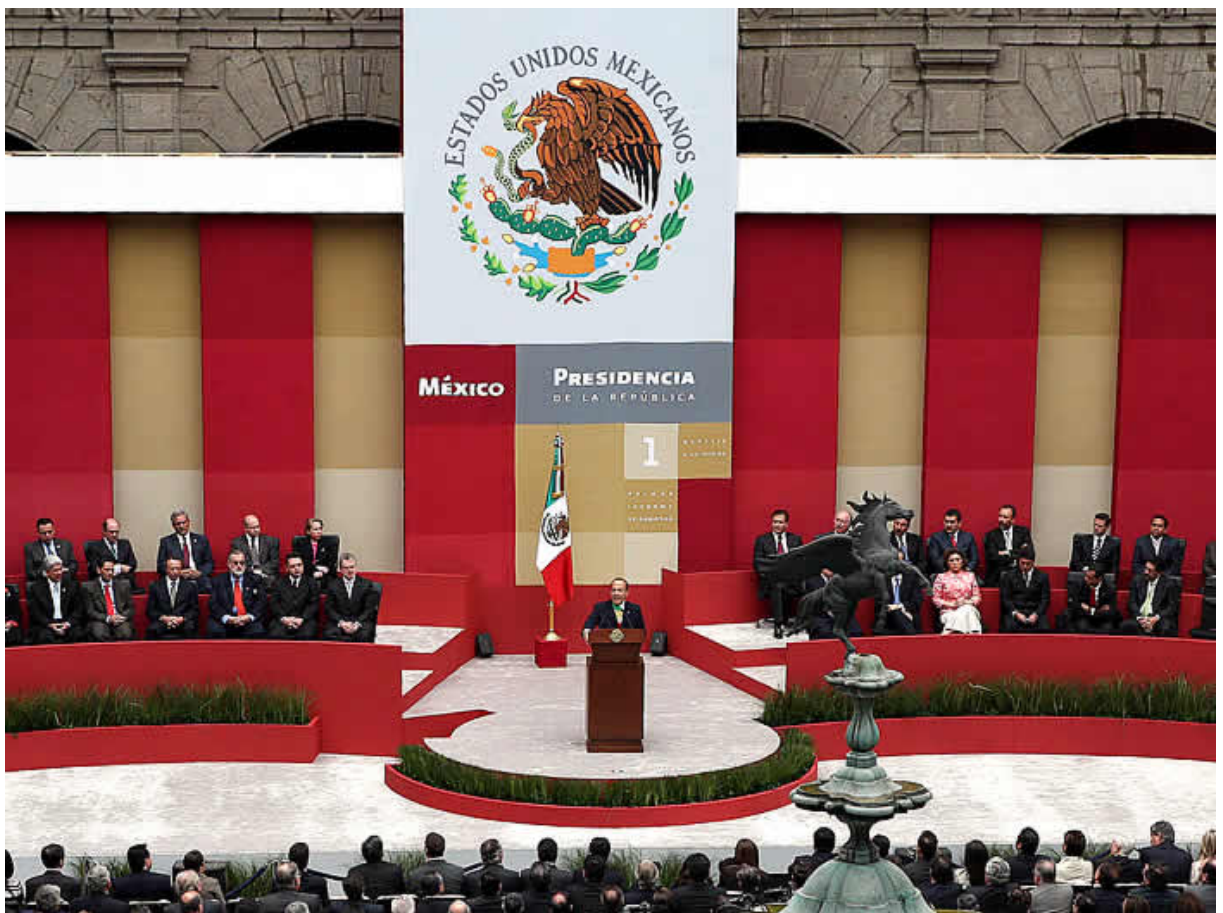
Sesión de presentación, primer informe de labores (México, 2007).