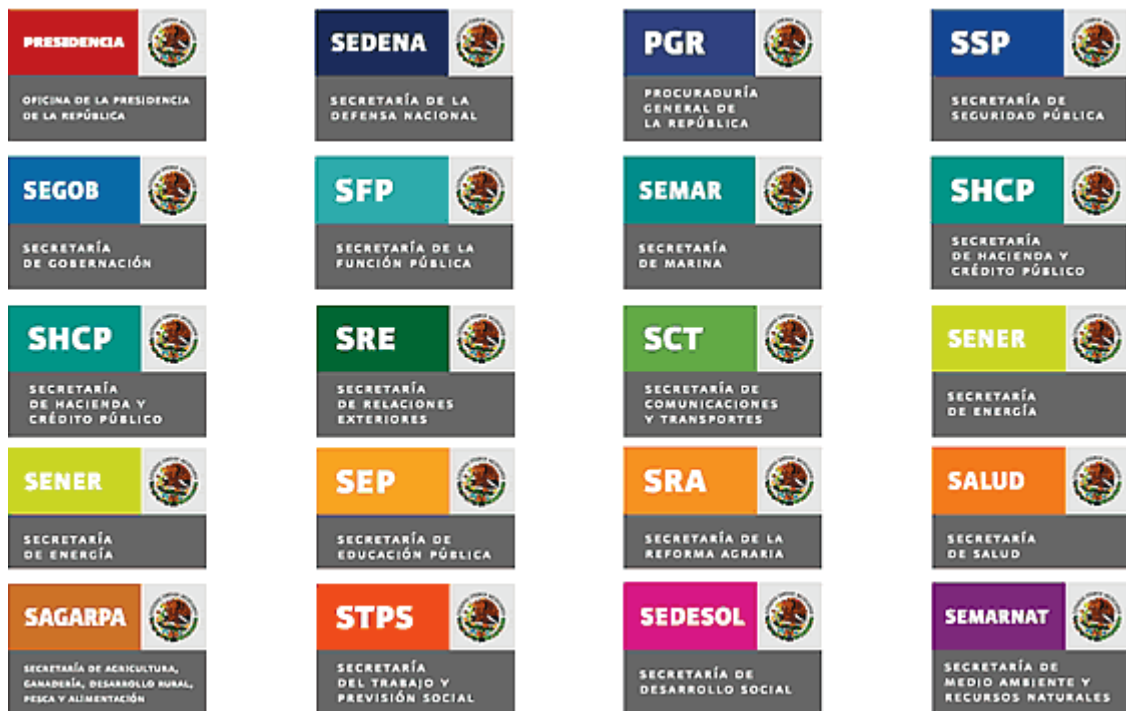
Sistema cromático para las 19 dependencias de gobierno.