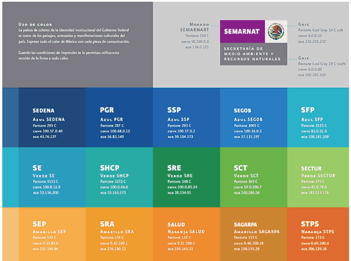
Uso de color (manual de identidad institucional).