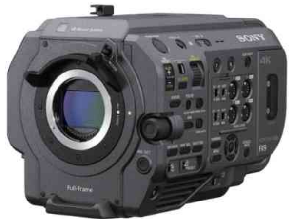
Logotipo de Sony en sus contextos de uso

Desde mi percepción, el único mensaje directo que transmite esta marca, puesta en sus contextos de uso, es su mensaje identificatorio más elemental; es decir, «esto lo dice» o «esto lo fabricó Sony». Y lo mismo sucede con todas las marcas, sean del tipo que sean. Todo mensaje adicional que se le quiera adjuntar a los signos identificadores de una organización o producto, se evapora automáticamente por el solo hecho de que al verlos en su contexto, los percibimos como firmas y no como mensajes.