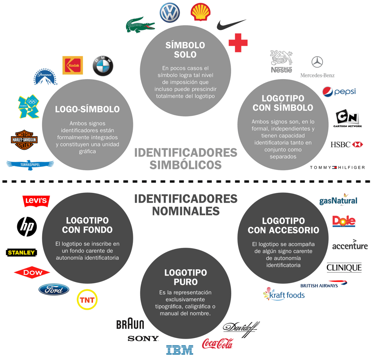
Esquema de megatipos de marcas gráficas (Cassisi, Belluccia, Chaves).

explorado: «los tipos marcarios». Todos los días se diseñan y re-diseñan en el mundo gran cantidad de marcas gráficas, lo cual amerita el que exista una mínima conceptualización, que ayude a la efectividad del trabajo de quienes dirigen programas marcarios y quienes diseñan marcas gráficas. 1 Recordemos la clasificación propuesta: