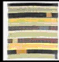
Anni Albers (textil)