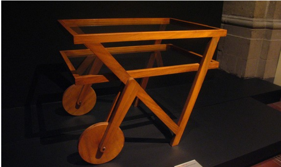
Móvel de Clara Porset, uma defensora do design para todos.

Clara Porset faleceu em 1981 e seus restos mortais encontram-se na Cidade do México. Deixou como legado sua figura visionária, empreendedora, inesquecível e um exemplo para todas as futuras designers latino-americanas, além de ter deixado sua biblioteca e projetos pessoais para o Centro de Investigaciones de Diseño Industrial UNAM. A própria UNAM cria o Prêmio Clara Porset para mulheres designers do continente, como homenagem a uma de suas figuras máximas.