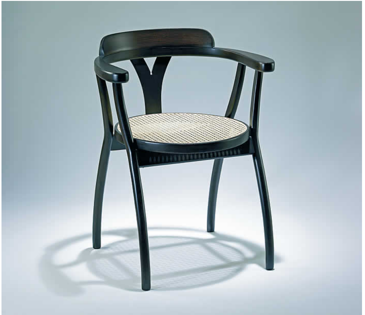
Fotografía de la pieza definitiva

Thonet y la razón de su diseño no es la necesidad de la gente de tener una nueva silla para elegir, sino que su razón de ser es la necesidad del diseñador de hacer una silla.