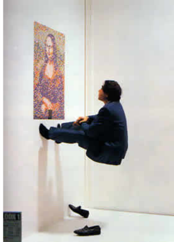
Fukuda. Exposición de afiches «Look 1», 1989.

¿Qué significan estos 10 conceptos?, tal vez podrían graficarse como las líneas que definen un camino claro por el que (más allá de los desvíos que cada época impone), quienes diseñamos siempre podemos volver a transitar.