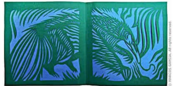
Tigre tricolor en cartulina canson. Portada de «novum plus», insert de la revista «novum» dedicado a la conferencia anual «Creative paper». Edición 10/10.