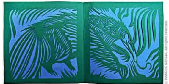
Tigre tricolor en cartulina canson. Portada de «novum plus», insert de la revista «novum» dedicado a la conferencia anual «Creative paper». Edición 10/10.