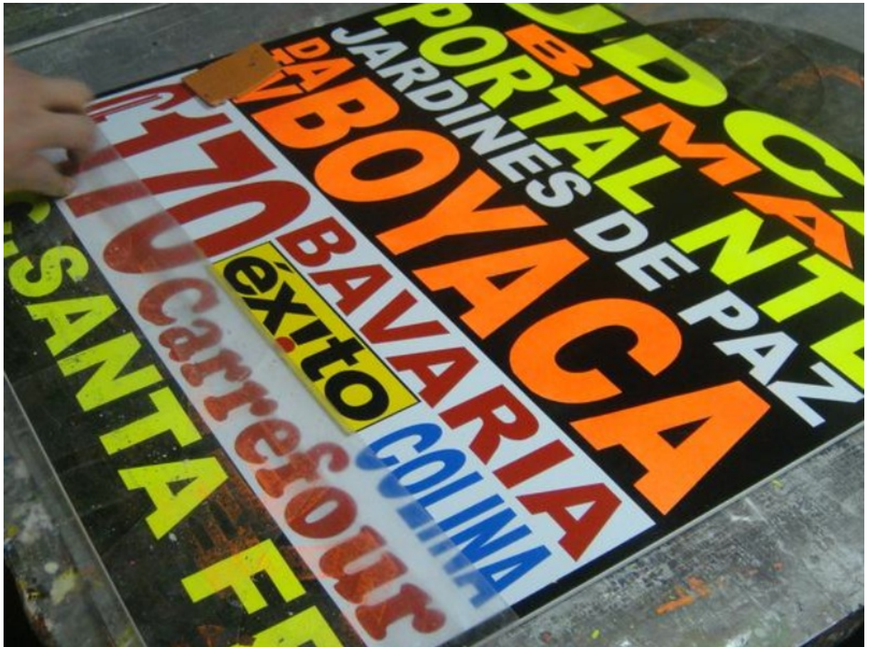
Tabla popular usada en el transporte público de Bogotá. 1

Leyendo un poco de la opinión pública respecto a las tablas del SITP, me encontré con la siguiente crítica: