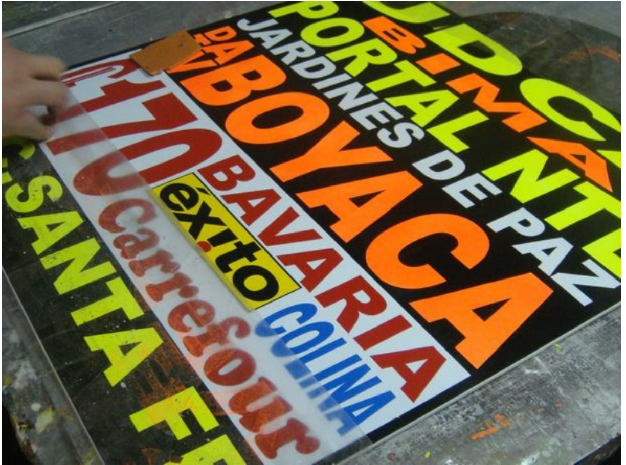
Tabla popular usada en el transporte público de Bogotá. 1

Leyendo un poco de la opinión pública respecto a las tablas del SITP, me encontré con la siguiente crítica: