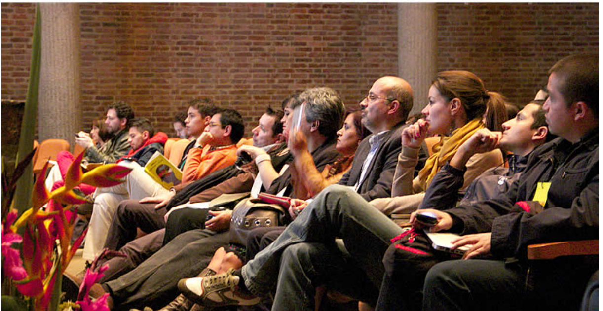
La jornada de conferencias fue muy valorada por los asistentes.