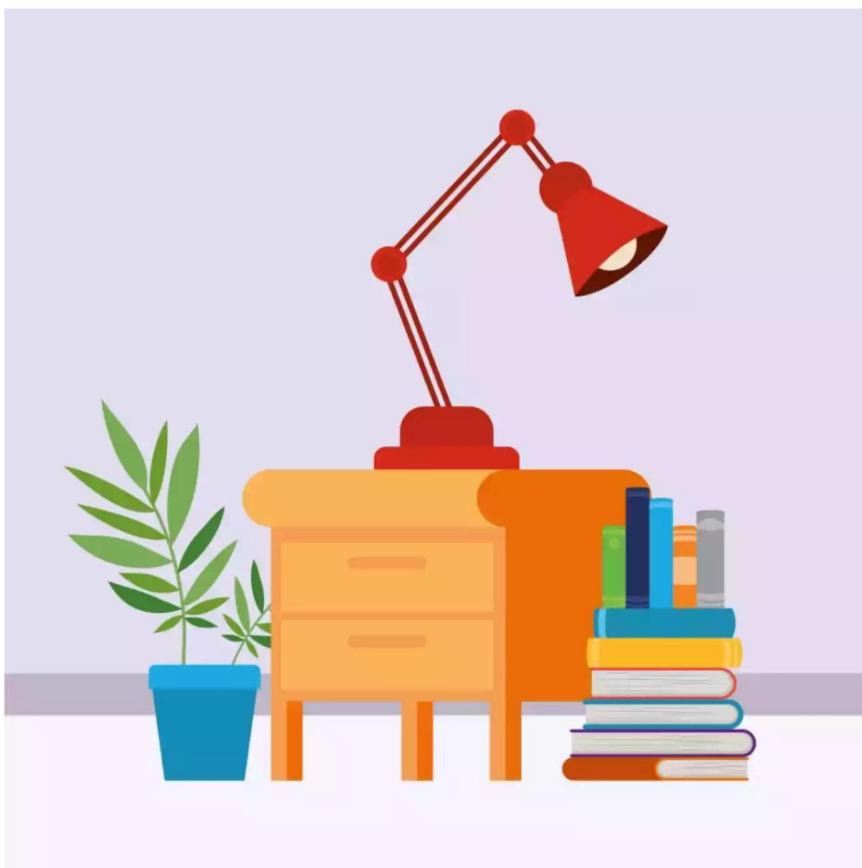
Ilustración creada con imagen de grmarc (freepik) .

Las mesitas de hoy en día todavía no dan respuesta a las necesidades tecnológicas actuales, ni a las necesidades de la sociedad actual de relajación antes de ir a dormir.