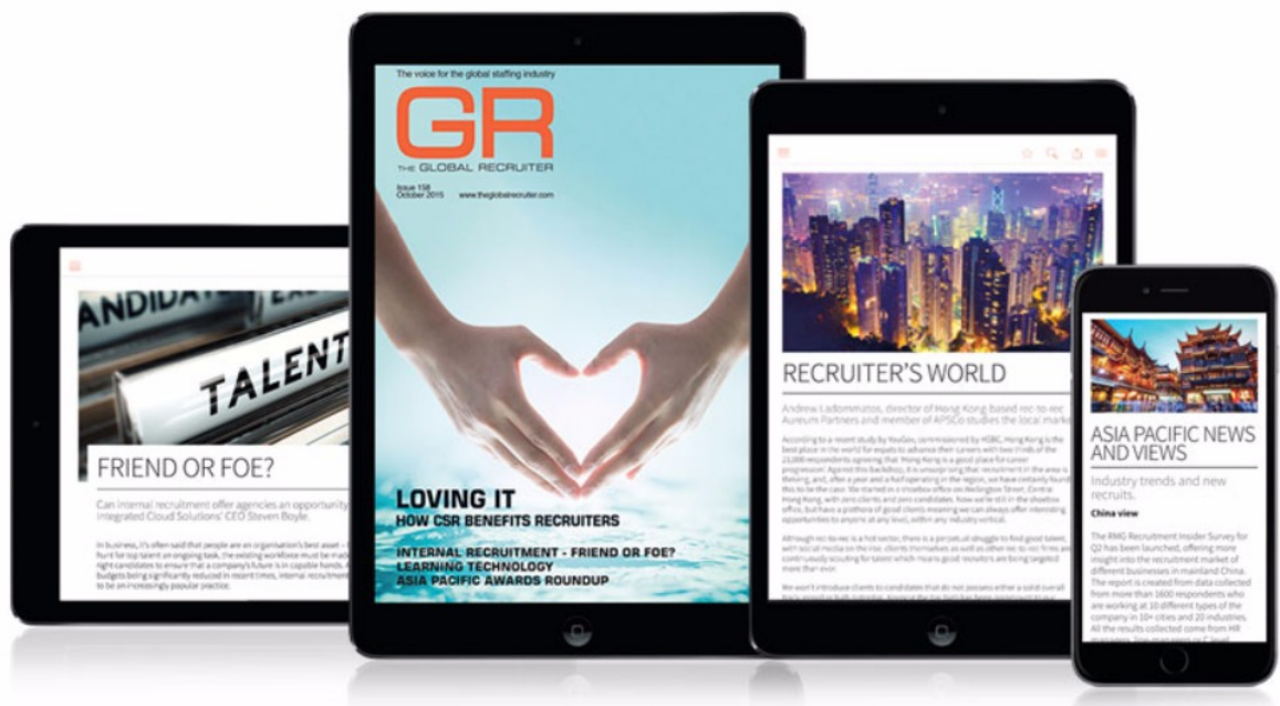
Global Recruiter, UK

En estos nuevos productos digitales, a los diseñadores nos toca el diseño de plantillas en los sistemas más avanzados, un tipo de trabajo que ya conocemos los diseñadores web. Se abre así un nuevo mundo de posibilidades, sobre todo en el desarrollo de UX (experiencia de usuario) y UI (interfaz de usuario).